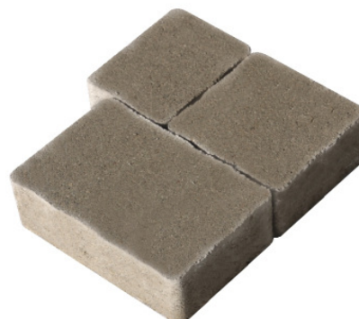
FINITURA AL QUARZO